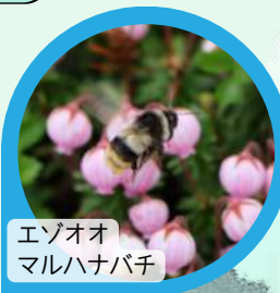
エゾオオマルハナバチ