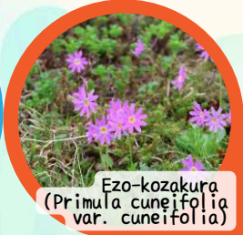
Ezo-kozakura (Primula cuneifolia var. cuneifolia)