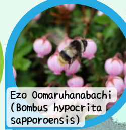
Ezo Oomaruhanabachi (Bombus hypocrita sapporoensis)