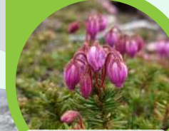
Ezonotsugazakura (Phyllodoce caerulea)

This week at the Sugatami area, despite rain and snow, a variety of alpine plants are blooming vigorously and beautifully. Please take a moment to seek them out.