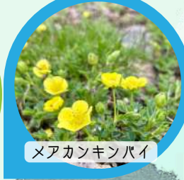
メアカンキンバイ