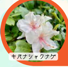
キバナシャクナゲ