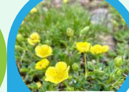
Meakankinbai (Potentilla miyabei Makino)