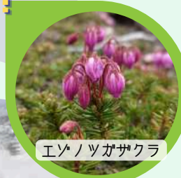
エゾノツガサクラ

今週の姿見の池園地は、雨や雪が降りましたが、様々な高山植物たちは、たくましく美しく花開かせています。その姿をさがしてみてください。