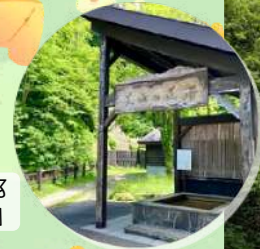
公共駐車場にある 『天女の足湯』

天人峡遊歩道は6月6日にオープンしました。遊歩道を15分程進むと羽衣の滝が見えてきます。この時期雪解けにて水位が上がり見ごたえあります。