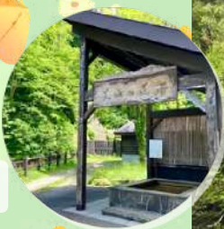
公共駐車場にある 『天女の足湯』