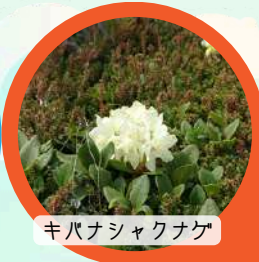
キバナシャクナゲ