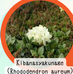
Kibanasyakunage (Rhododendron aureum)