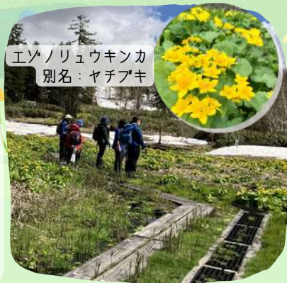
エゾノリュウキンカ 別名：ヤチアキ