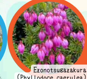
Ezonotsugazakura (Phyllodoce caerulea)