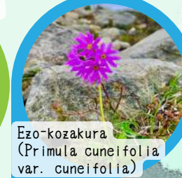
Ezo-kozakura (Primula cuneifolia var. cuneifolia)