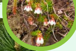
Zimukade (Harrimanella stelleriana (Pall.) Coville)

Showy Kibanasyakunage and Ezo-kozakura flowers are prominent in this area. Late-blooming Oriental Swamp Pink is also flowering. With various flowers in bloom, enjoy your walk while discovering them.