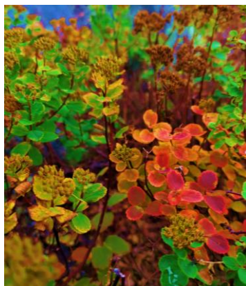
エゾノマルバシモツケの紅葉