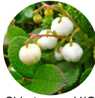
Shiratanonoki(Ga ultheria pyroloides) berries