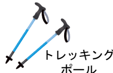
トレッキング ポール