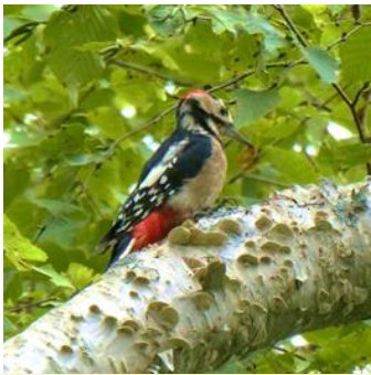
Great Spotted Woodpecker

At the Asahidake youth campground, birdwatching is recommended as you can see wild birds up close. If you're lucky, you might encounter an Ezo ptarmigan. Along the nature trails, brown bear droppings, footprints, and other signs were found in August. Please check the latest information at the Visitor Center. The campground's final operating day is September 30th.