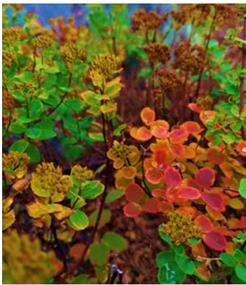
エゾノマルバシモツケの紅葉