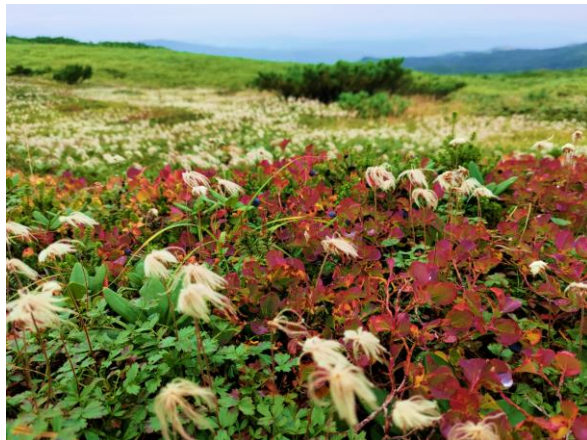
チングルマの綿毛とクロウスゴの紅葉

姿見の池園地では、例年に比べ、ナナカマドの葉に変色が見られます。チングルマやクロウスゴ、エゾノマルバシモツケなどの草紅葉が少しずつ始まっています。また、最近は植物の実や種子を食べるエゾシマリスやホシガラスの姿が見られています。散策では寒く感じることもあるため、体温調節できる恰好でお願いいたしますと安心です。