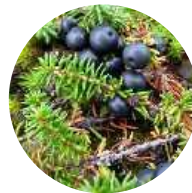
ガンコウランの実