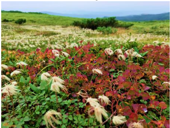
Aleutian Avens seed heads and Oval-leaf bilberry autumn foliage

In the Sugatami area, compared to typical years, discoloration can be seen in the leaves of rowan. The autumn foliage of alpine plants such as Aleutian Avens, Oval-leaf bilberry, and Alaska Spiraea is gradually beginning. Recently, Siberian Chipmunks and Spotted Nutcrackers can be seen eating plant berries and seeds. During walks, it can sometimes feel cold, so it's reassuring to come dressed in layers that allow for temperature regulation.