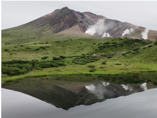
Mt. Asahidake reflected in Kagami Pond

In the Sugatami area, where the Aleutian Avens season has ended, Haiotogiri ( Hypericum kamtschaticum ) and Golden Rod are now at their peak bloom. The carnivorous plant Sundew can also be seen more abundantly than usual this year, making it easier to spot. Around the walking trails at approximately 1600m elevation, temperatures are about 10°C lower than in town, so layered clothing is recommended. If the ground is muddy or conditions are poor underfoot, please use our rental boots for 500 yen per pair.