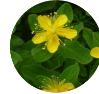
Haiotogiri ( Hypericum kamtschaticum )