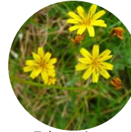
Takanenigana ( Ixeris dentata ssp. alpicola )