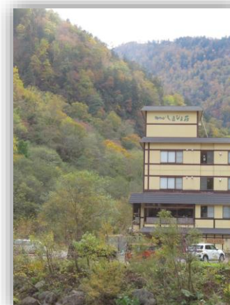
しきしま荘と忠別川