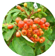
ウラジロナナカマドの実