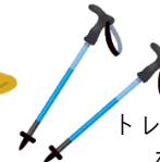
トレッキング ポール