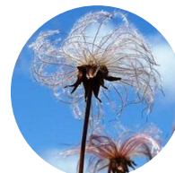
チングルマの綿毛