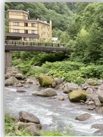
しきしま荘と忠別川