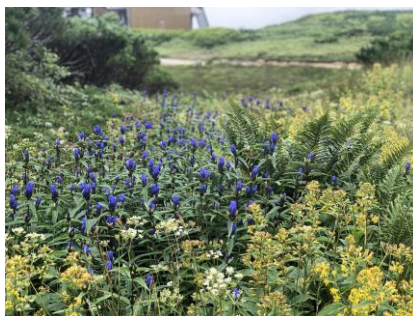
エゾオヤマリンドウ