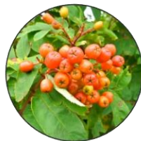
ウラジロナナカマドの実