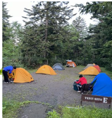
旭岳青少年野営場

旭岳青少年野営場はチェックアウト時間が10時に設定されました。それ以降滞在の場合(18時まで)は日帰り料金(100円)がかかります。野営場には管理人が毎日掃除をしているログハウス風のトイレがあり、空いていれば使用可能な電源2口、WIFI完備しております。