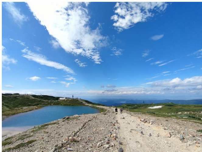
噴気孔から姿見の池へ