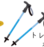
トレッキング ポール