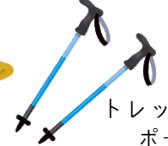
トレッキング ポール