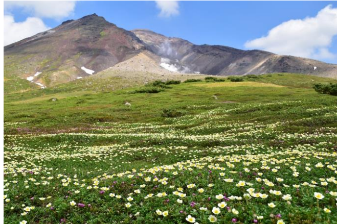
チングルマの群落

例年より季節の進みが早い旭岳ですが、春から初夏にかけて咲く花がほとんど見られ、とても賑やかです。チングルマの群落も大きくなり見ごたえがあります。ギンザンマシコ、ノゴマ、カヤクグリなど野鳥の姿も楽しめます。