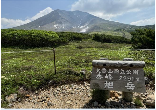
チングルマの群落

例年より雪融けが早い分、花々たちの開花も1週間から10日早いようです。。また、雪融け後低温に曝されたためか、花々のボリュームも若干少ない印象です。でも姿見の池園地は、花々の入れ替わりもあり、賑やかさは変わりません。