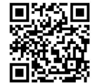
旭岳ロープウェイHP