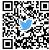
保全員 X (旧 Twitter)