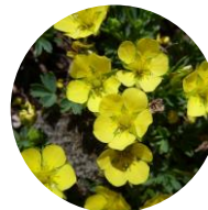
メアカンキンバイ