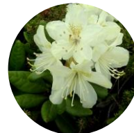
キバナシャクナゲ