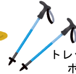
トレッキング ポール