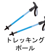
トレッキング ポール