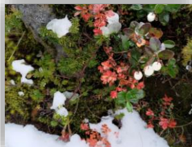
植物に積もった雪