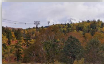
山麓から見る紅葉