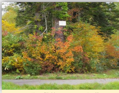
野営場散策コースの紅葉