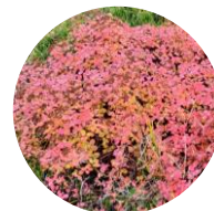
エゾノマルバシモツケ