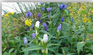
エゾオヤマリンドウ