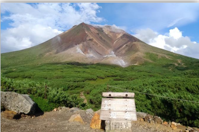
雷雨直後に現れた旭岳