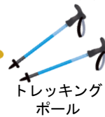
トレッキング ポール