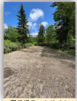
野営場テントサイト