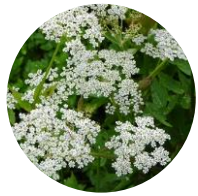
ハクサンポウフウ