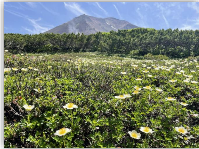
第1展望台下のチングルマと旭岳

姿見の池園地内のチングルマが群生していた大きな花畑は少なくなりました。園地内では雪解けが遅かった場所でチングルマやツガザクラをいまだに見ることができ、開花時期の遅いミヤマリンドウやイワブクロなどの姿も見られるようになりました。少し移動するだけで違った色、種類の植物が目立つ散策路をお楽しみください。