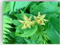
ハゴロモホトトギス