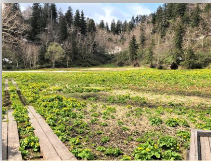
エゾノリュウキンカ