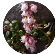
コメバツガザクラ