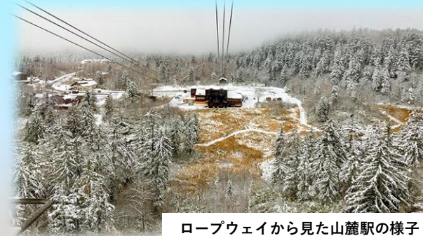
ロープウェイから見た山麓駅の様子 10/19