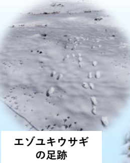
エゾキウサギ の足跡