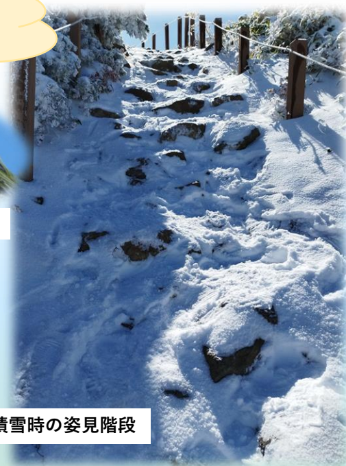
積雪時の姿見階段