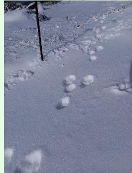
『エゾユキウサギの足跡』