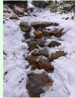
『散策路内の階段の様子』

今年もついに、旭岳に本格的な冬がやってきました。高山植物も雪の中に隠れ、次の春を待つ準備を整えています。山道は凍結することもありますので、お車では冬タイヤにご準備の上お越しく下さい。