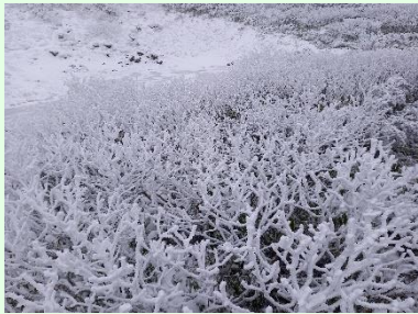
『サンゴのようなウラジロナナカマド』