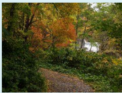
『羽衣の滝までの遊歩道』