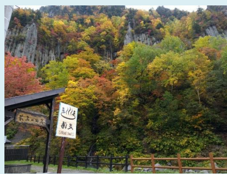
『駐車場の足湯付近より』

現在紅葉がピークを迎えています。駐車場から羽衣の滝までは往復40分ほどです。標高差もほとんど無く、お手軽な散策ができます。ぜひお訪ねください。