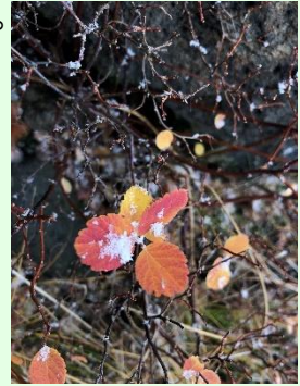
『エゾノマルバシモツケ』