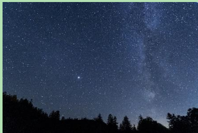
『野営場からの星空9/6撮影』