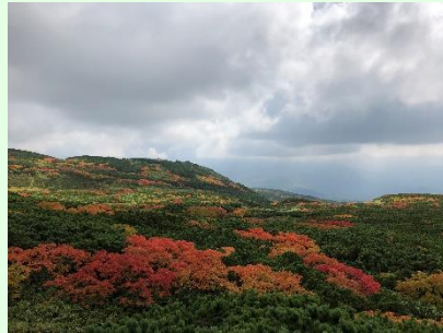
『第1展望台からの眺め』

急に紅葉の進んだ旭岳では、どこを見渡しても紅葉を楽しめます。ウラジロナナカマドは、紅葉も綺麗ですが冬芽も立派です。もうすぐ来る冬に備えています。