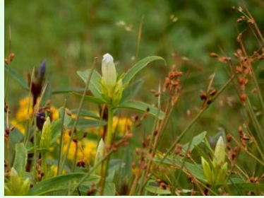
『白いエゾオヤマリンドウ』