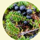
ガンコウランの実