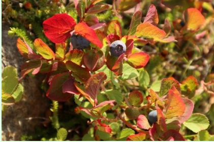
『クロウスゴの紅葉と実』

ナナカマドやクロウスゴの葉が赤く染まりだしました。 白いエゾオヤマリンドウの花も少しずつ咲いてきていますので、 足元をよく観察し探してみるのも、散策の楽しみ方の一つです。