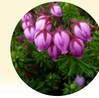
エゾノツガザクラ