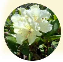
キバナシャクナゲ