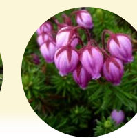
エゾノツガザクラ