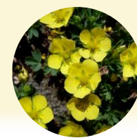
メアカンキンバイ