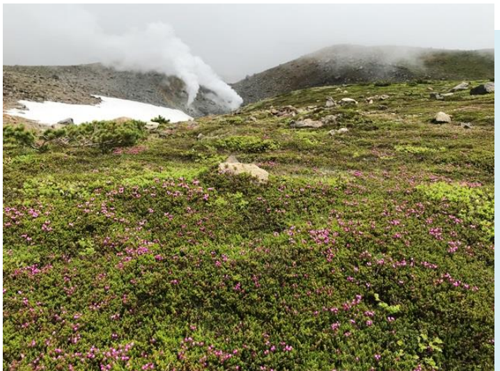
エゾノツガザクラと旭岳の噴気