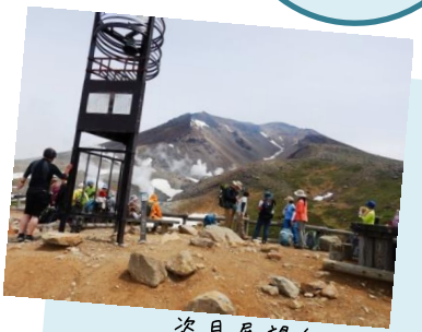
姿見展望台と旭岳