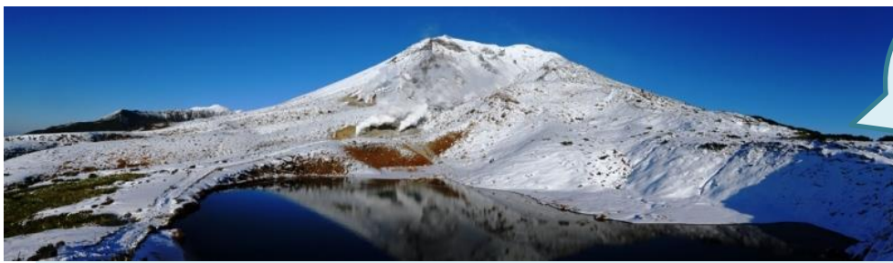
姿見展望台からの旭岳