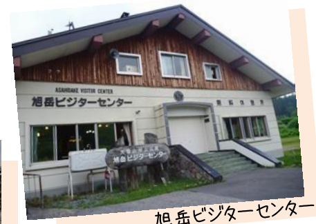
旭岳ビジターセンター

旭岳温泉街に雪が降ることもあります。道路の路面状況、日帰り入浴の情報など、旭岳ビジターセンターにお問い合わせください。(開館時間：9時～17時)