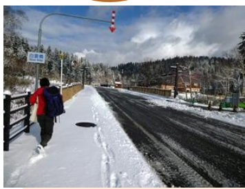
旭岳温泉街の道路