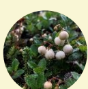
シラタマノキの実