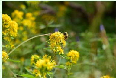
『ミヤマアキノキリンソウ』