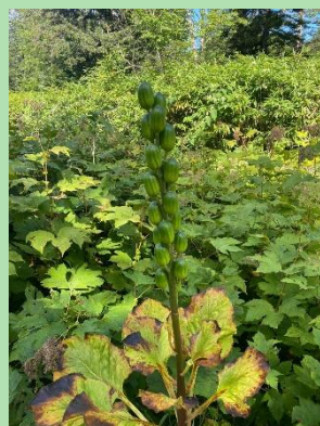
『オオウバユリの実』