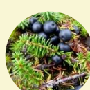
ガンコウランの実