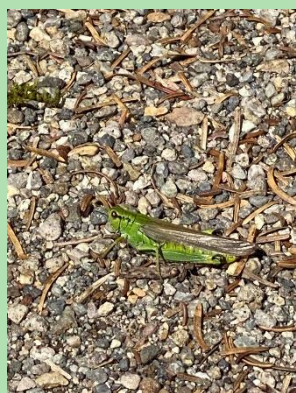
『ハネナガフキバツタ』