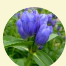
エノヤマリンドウ