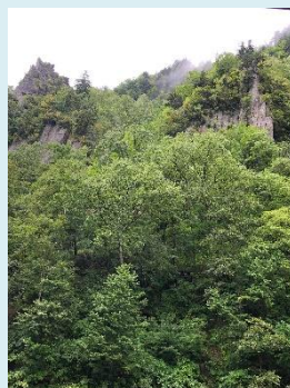
『足湯からの景色。柱状節理』

遊歩道には、羽衣の滝があります。駐車場にある足湯やそこから見える柱状節理、しきしま荘の温泉もお楽しみください。