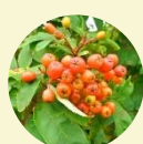
ウラジロナカマドの実