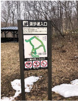
①展望閣広場 遊歩道入口標識