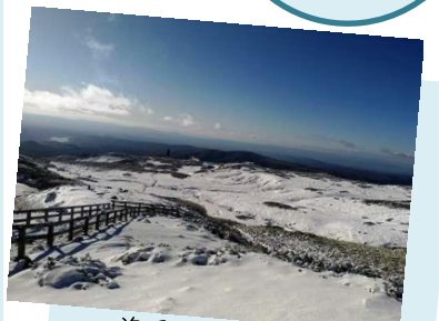
姿見展望台からの景色