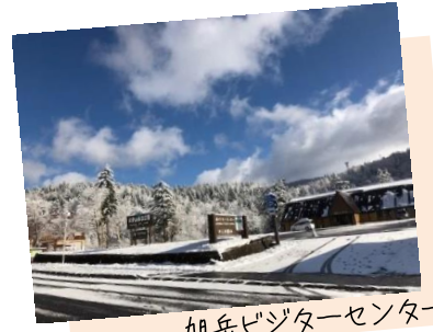
旭岳ビジターセンター

標高1,100m付近にある旭岳温泉街にもミズレや雪が降る時期になりました。道路の路面状況、日帰り温泉情報は、旭岳ビジターセンターにお尋ねください。(開館時間：9時～17時)