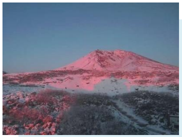
夕日に染まる旭岳

散策路外の雪の下では、来年花を咲かせる高山植物がお休み中です。散策路外には出ないでください。