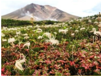
チンゲルマの紅葉

姿見の池園地周辺では、ウラジロナナカマドの葉が色付き始めています。足元では高山植物の葉が早くも色付いてきており、散策路を彩っています。