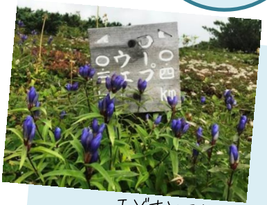
エゾオヤマリンドウ

姿見の池園地の様子 標高1,600m、一周1.7km、約1時間で歩ける散策路があります。9月に入りいよいよ紅葉が進んできました。散策路ではエゾオヤマリンドウなど秋の花が見られます。エゾシマリスなどの野生動物や野鳥の貴重な食糧となる木の実も増えてきました。日本一早いと言われている大雪山の紅葉の始まりを、ぜひ見にお越しください。 ※休日は駐車場やロープウェイの混雑が予想されます。ご注意ください。