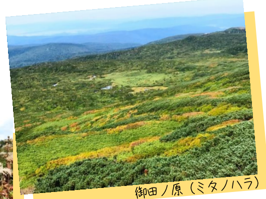
御田ノ原(ミタノハラ)

姿見の池園地周辺では、ウラジロナナカマドの葉が色付き始めています。足元では高山植物の葉が早くも色付いてきており、散策路を彩っています。