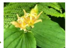
ハゴロモホトトギス