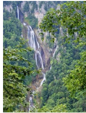
滝見台(軽登山道)からの羽衣の滝

遊歩道を約15分ほど歩くと、羽衣の滝が見られます。道沿いでは森林浴や野草の花々を楽しめます。駐車場にある足湯やしきしま荘の日帰り温泉もご利用ください。