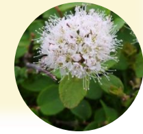
エゾマルバシモツク