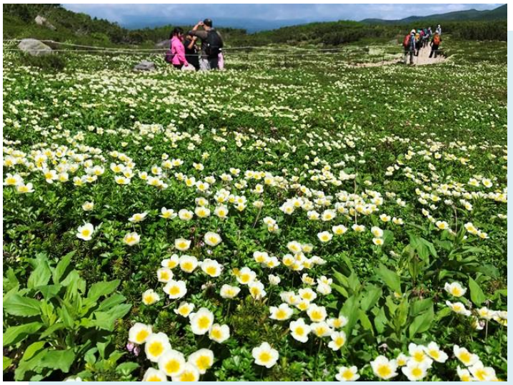
チンゲルマの花畑