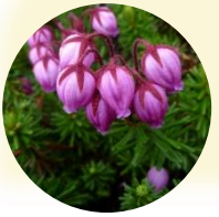
エゾノツガザクラ