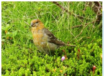
ギンザンマシコ (メス)

姿見の池園地の様子 一周1.7km、約一時間の散策路を歩くとチンゲルマの花畑や、30種類以上の高山植物の花を楽しめます。エゾシマリリスやキタキツネ、エゾキウサギなどの野生動物、ノゴマやギンザンマシコなど野鳥と出会うこともあります。ぜひ涼みにお越しください。