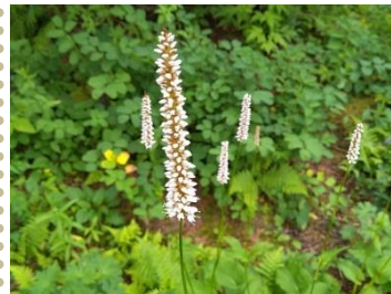
タカネトウウチソウ

旭岳温泉街にある勇駒引高山植物園では手軽に高山植物を楽しめます。探勝路や旭岳青少年野営場も、野草や野鳥の観察にオススメです。