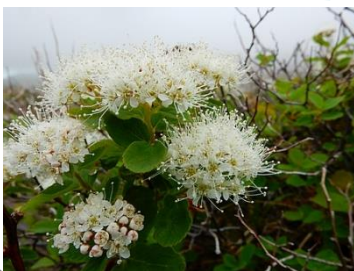
エゾノマルバシモツク