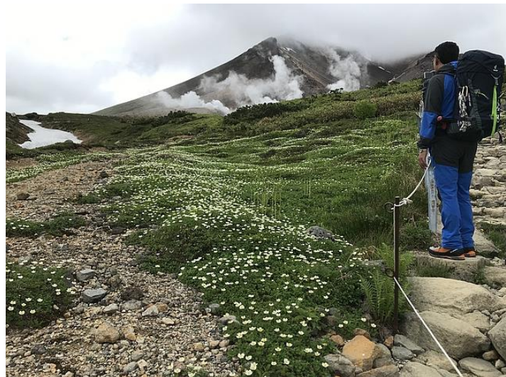
チングルマと旭岳

姿見の池園地の様子 現在、花盛りです。散策路のあちらこちらでチングルマの花畑を楽しめます。他にも30種類以上の高山植物の花が見られます。エゾシマリスやキタキツネ、エゾキウサギなどの野生動物、ノゴマやギンザンマシコなど野鳥の姿も楽しめます。