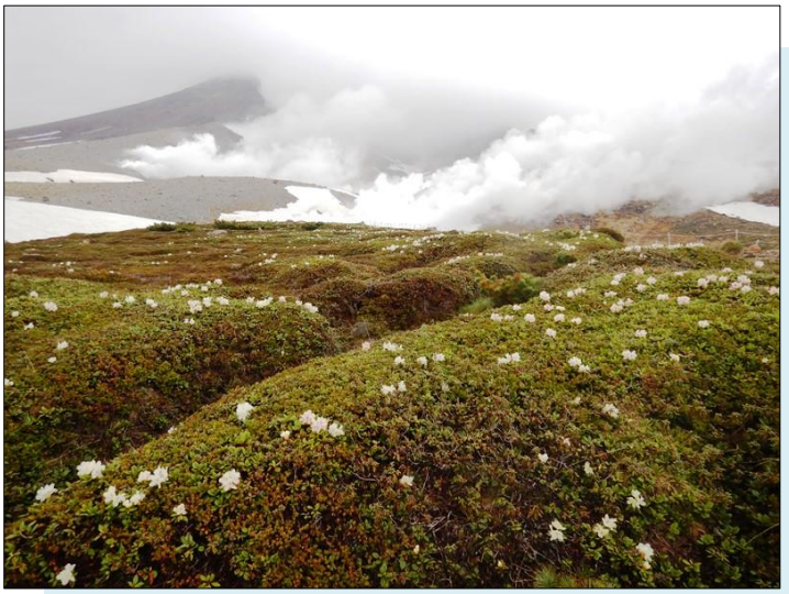
キバナシャクナゲと旭岳の噴気

姿見の池園地の様子 姿見駅前から各展望台へ行くには雪や水たまりを歩きます。姿見駅にあるレンタル長靴（一足300円）をご利用ください。鏡也と姿見の池が溶け始めました。展望台などでは高山植物が咲き始め、キバナシャクナゲが見頃です。エゾシマリリスやキタキツネなどの野生動物、ゲンザンマシコやノゴマなど野鳥の姿も見られます。