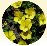
メアカンキンバイ