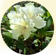
キバナシャクナゲ