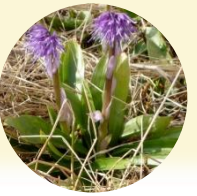
シヨウジョウバカマ