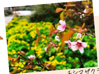
チシマザクラと エゾノリュウキンカ