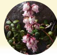
コメバツガザクラ