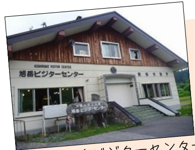
旭岳ビジターセンター

旭岳温泉街にも雪が降る時期になりました。道路の路面状況、日帰り入浴の情報など、旭岳ビジターセンターにお尋ねください。 (開館時間：9時～17時)