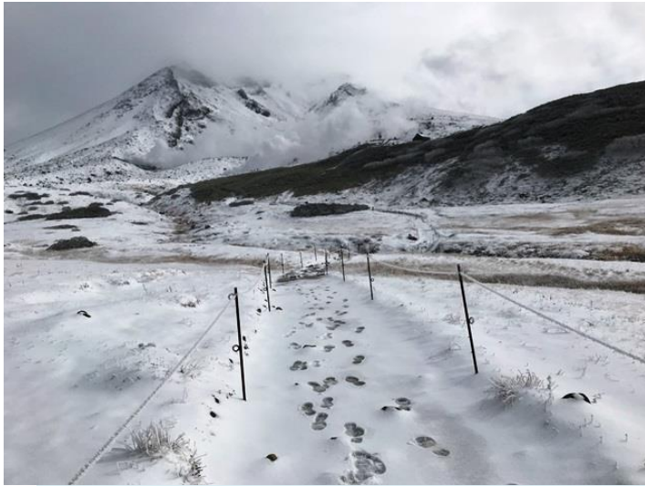
雪に覆われた散策路と旭岳