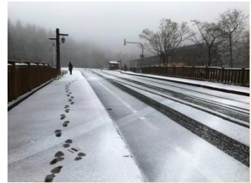
旭岳温泉街の道路 (10/18)