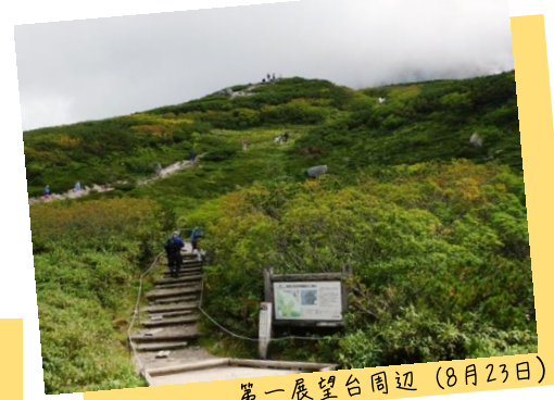
第一展望台周辺 (8月23日)