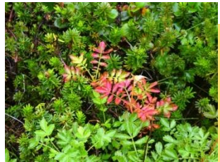
色付くチングルマの葉

姿見の池園地ではウラシロナナカマドの葉が早くも つすらと色付き始め ています。足元の高山植物も、一部の葉が色付き始めています。紅葉の始まりをお楽しみください。