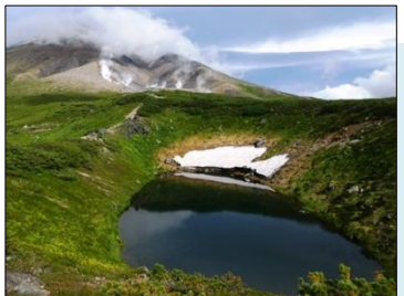
すり鉢池の淵に残る雪