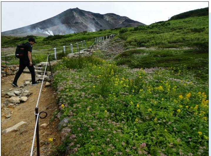
ミヤマアキノキリンソウと旭岳