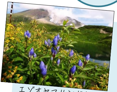
エゾオヤマリンドウと旭岳