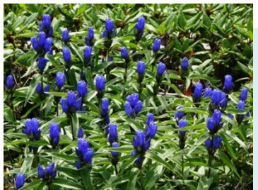
エゾヤマリンドウ

姿見の池園地の様子 池の淵などでは、8月になってもまだ雪が残る風景が見られます。エゾオヤマリンドウが咲き始めました。チングルマの綿毛やミヤマアキノキリンソウなどが風に吹かれて揺れています。エゾシマリリスやキタキツネなどの野生動物や、ノゴマなど野鳥の姿も見られます。