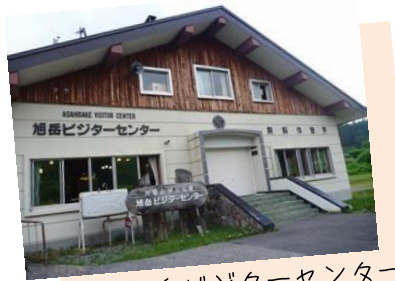
旭岳ビジターセンター

旭岳周辺の登山情報や、旭岳温泉街にある探勝路などの情報は、旭岳ビジターセンターにお問い合わせください。休憩室や展示コーナーもあります。