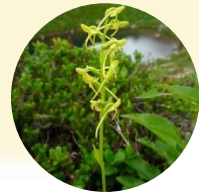
ホソバノキノコドリ