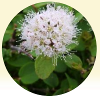
エゾノマルバシモツク