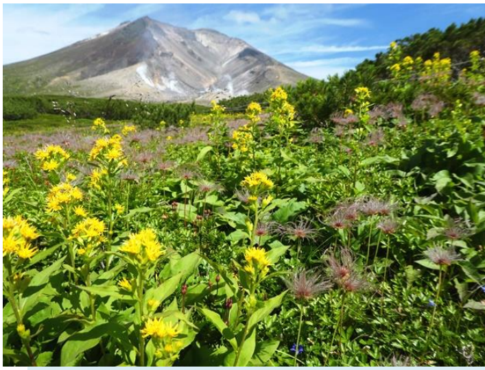
ミヤマアキノキリンソウと旭岳

木々に囲まれた遊歩道を進んでいくと、羽衣の滝が姿を現します。駐車場にある足湯や、日帰り温泉もご利用ください。