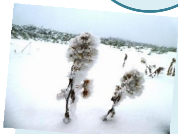
Solidago virgaurea ssp. asiatica