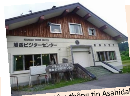
Trung tâm thông tin Asahidake

Tuyết đã rơi trên con phố đi bộ khu nước khoáng nóng. Tùy vào tình hình thời tiết và mặt đường có đóng băng hay không, quý khách hãy liên lạc với trung tâm du lịch để biết thêm chi tiết (giờ làm việc 9h đến 17h)