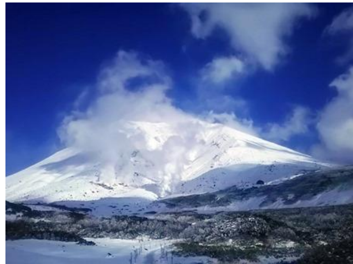
Tuyết phủ trên đỉnh Asahidake