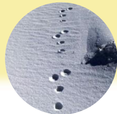
Thỏ tuyết Hokkaido