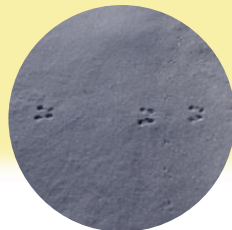
Sóc đảo Hokkaido