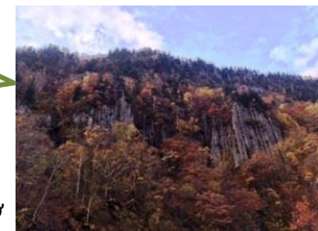
Cột đá Columnar joints

Nước khoáng nóng Cột đá tự nhiên Hồ nóng ngâm chân