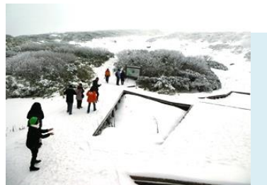
Trước ga Sugatami