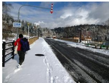
Phố nước nóng Asahidake

Tuyến đường Tanshoji Vườn thực vật núi cao