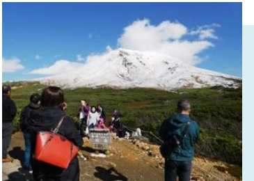
จุดชมวิวกที่ 1