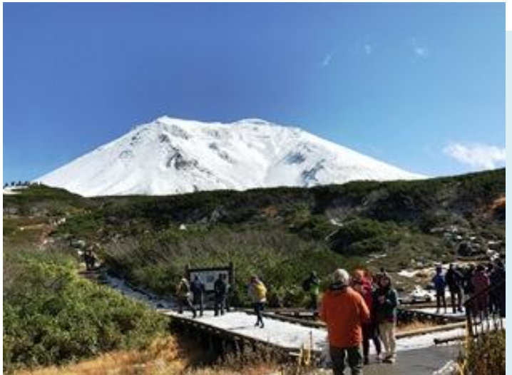
ยอดเขาอาซาฮิดากะที่ชาวโพลนไปด้วยหิมะ

Asahidake ทางปีนเขา และ รอบมิ่ง Sugatami