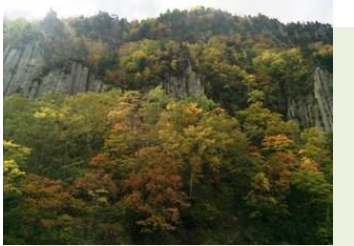
แนวผาหิน

Tenninkyo ทางเดินเชื่อม ไปออนเซ็น และ สปาเท้า