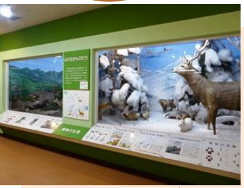
มุมจัดแสดงข้อมูล

Asahidake Onsen ทางเดินป่า อุทยานพันธุ์ไม้ภูเขา