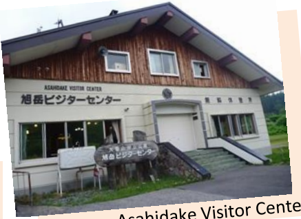
Asahidake Visitor Center

หิมะก็ตกที่ย่านอาซาฮิดากะออนเซ็นเช่นกัน สามารถสอบถามข้อมูลสภาพผิวถนน และแหล่งออนเซ็นต่างๆ ได้ที่ Asahidake visitor center