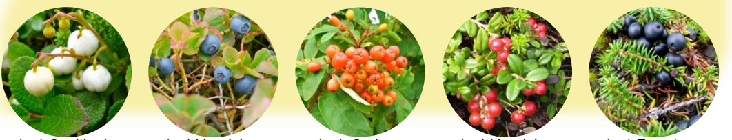
(ผล) Gaultheria miqueliana (ผล) Vaccinium ovalifolium (ผล) Sorbus matsumurana (ผล) Vaccinium vitis-idaea (ผล) Empetrum nigrum var. japonicum