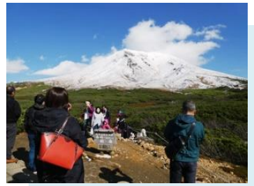
Lokasi observasi 1