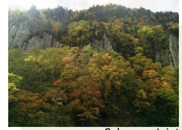
Columnar Joint & Daun Musim Gugur