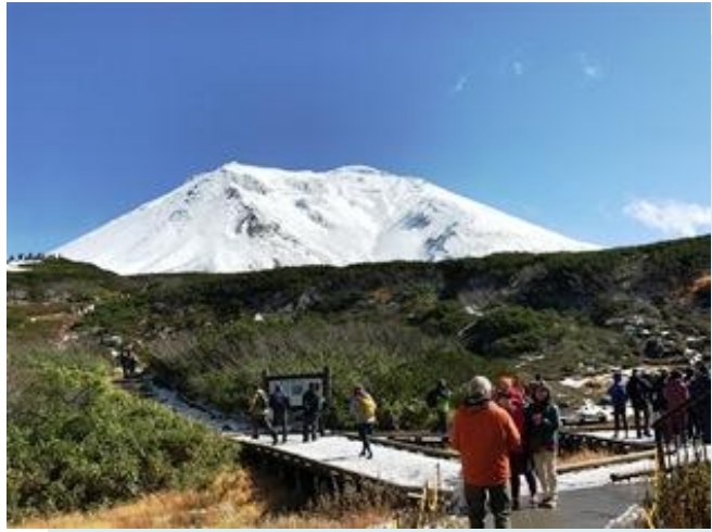
Asahidake Berselimut Salju

Asahidake Jalur pendakian taman Sugatami