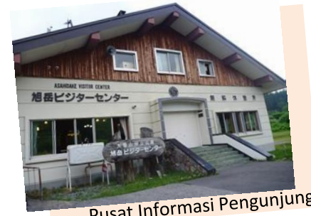
Pusat Informasi Pengunjung

Ada kalanya salju turun di Asahidake Onsen-gai. Silahkan kunjungi pusat informasi pengunjung untuk mendapatkan informasi mengenai kondisi jalan dan informasi mengenai onsen. (Buka : 09:00-17:00)