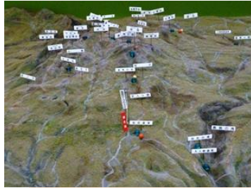
다이세쓰 산의 투시도