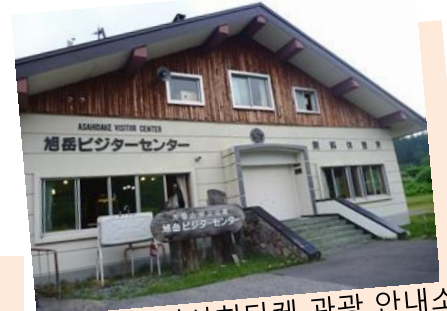
아사히다케 관광 안내소

아사히다케 주변 등산과 아사히다케 온천 마을이 있는 탐승로 등의 정보는 아사히다케 관광 안내소에 문의하여 주십시오 휴게실과 전시코너도 있습니다.