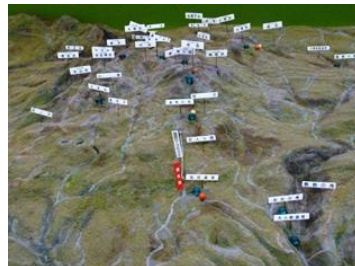
大雪山的生态立体图